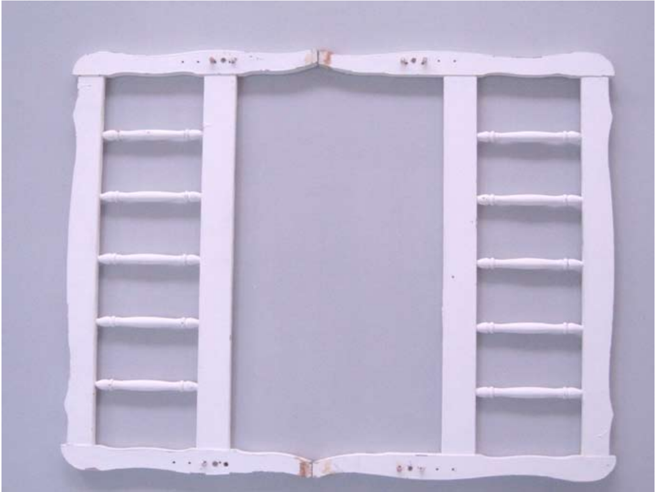
Jacob's Ladder, 2007