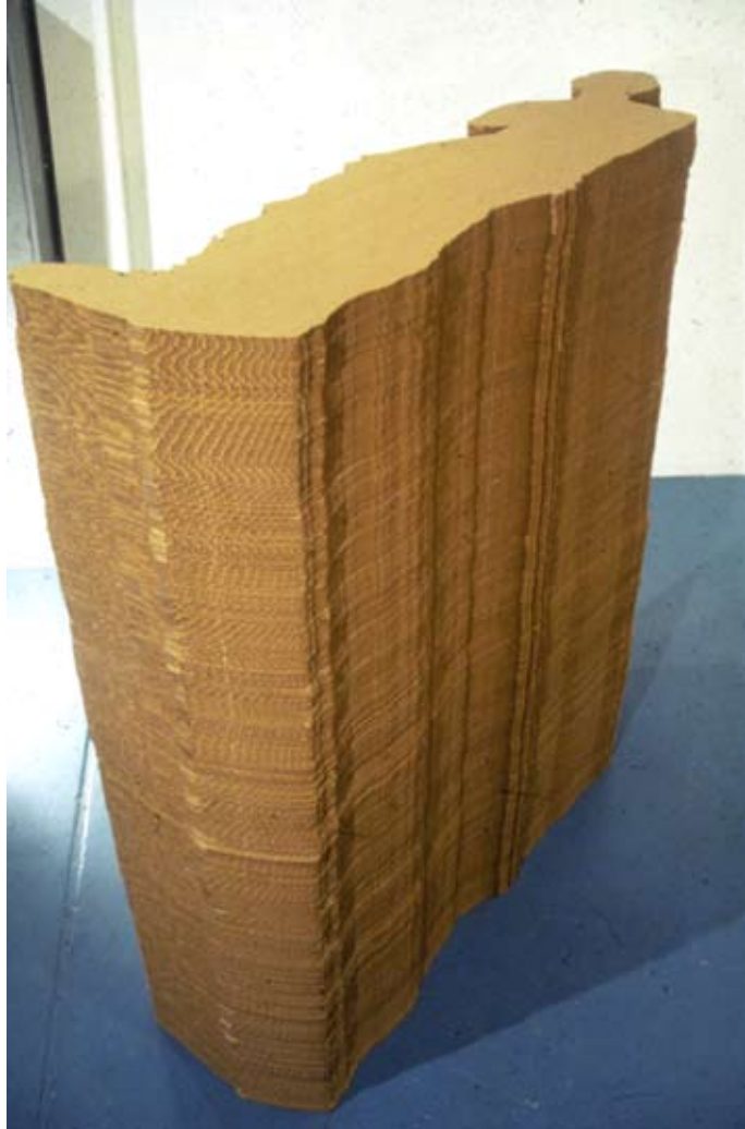
Venus de Milo, 1991