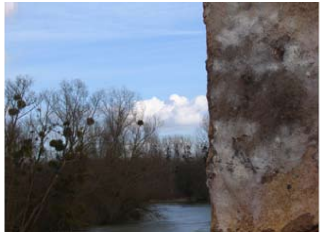
Here and Elsewhere 1, 2 et 3, 2007 (112 x 76 cm)