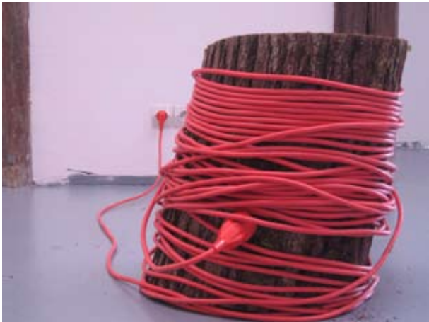
Art, Science, Technology , 2007 160 x 49 x 43 cm bois, rallonge électrique / wood, electrical cord