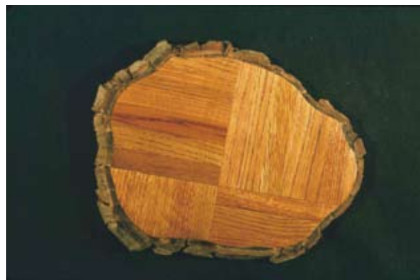
Floor Show , 1999