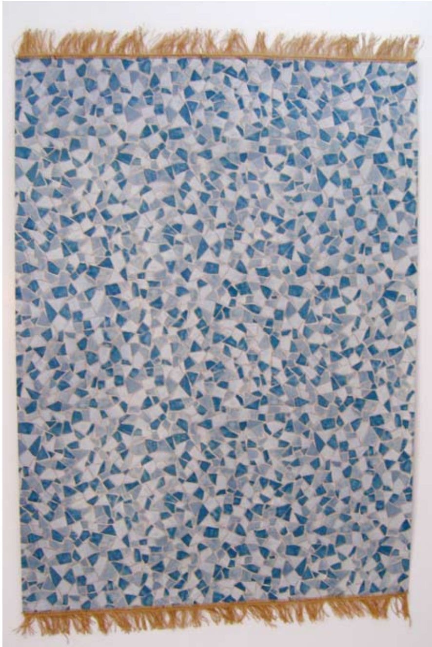
Blues for Moses , 2007 226 x 150 cm