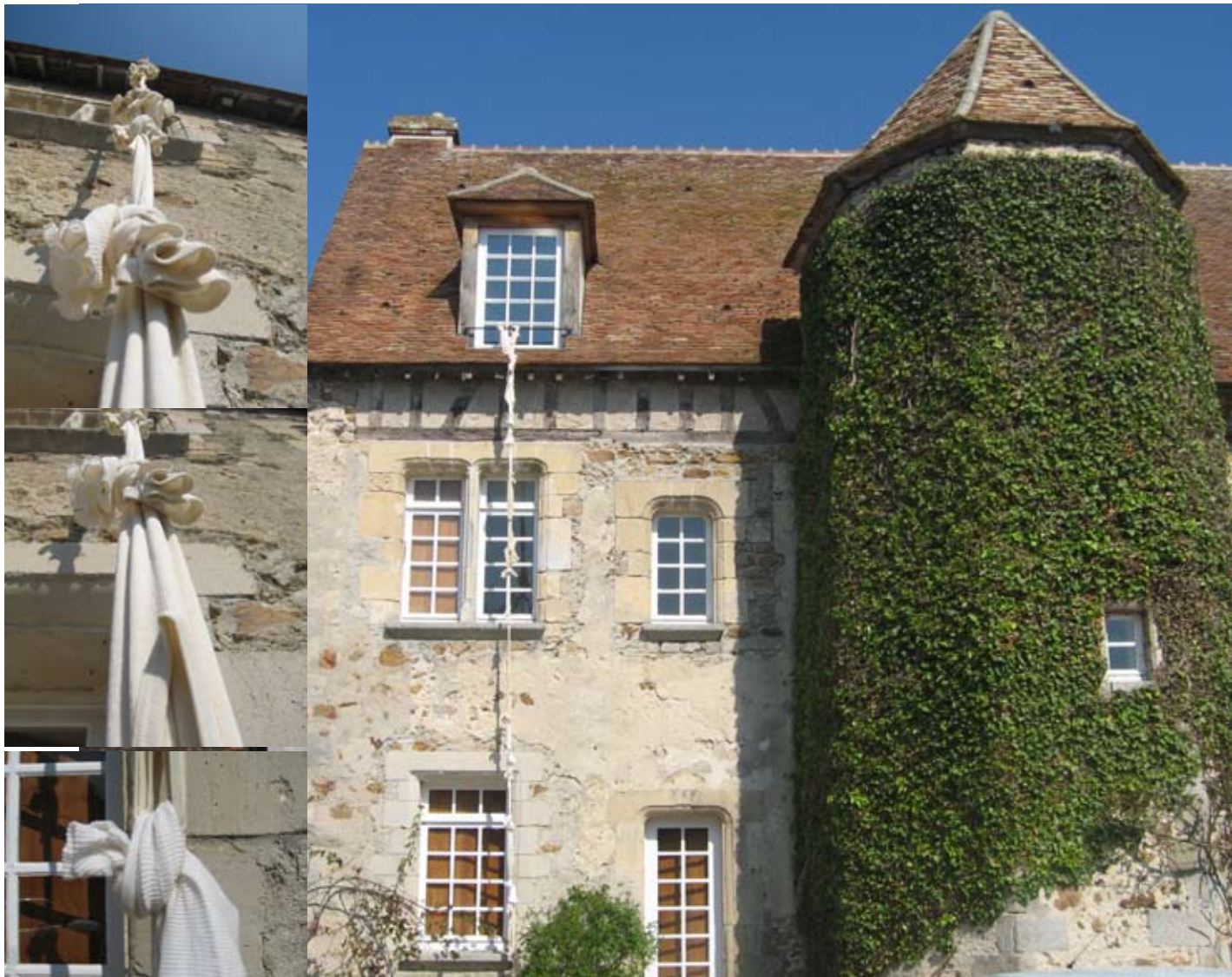
Collection d'hiver, 2007 ; Installation